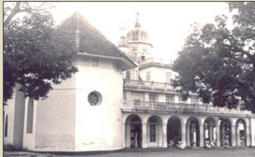
Old Parumala Church