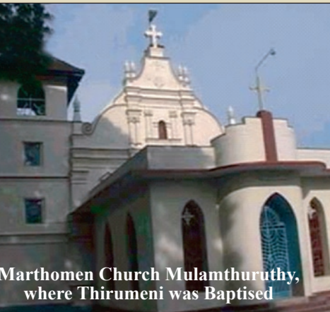
Marthomen Church Mulamthuruthy, where Thirumeni was Baptised